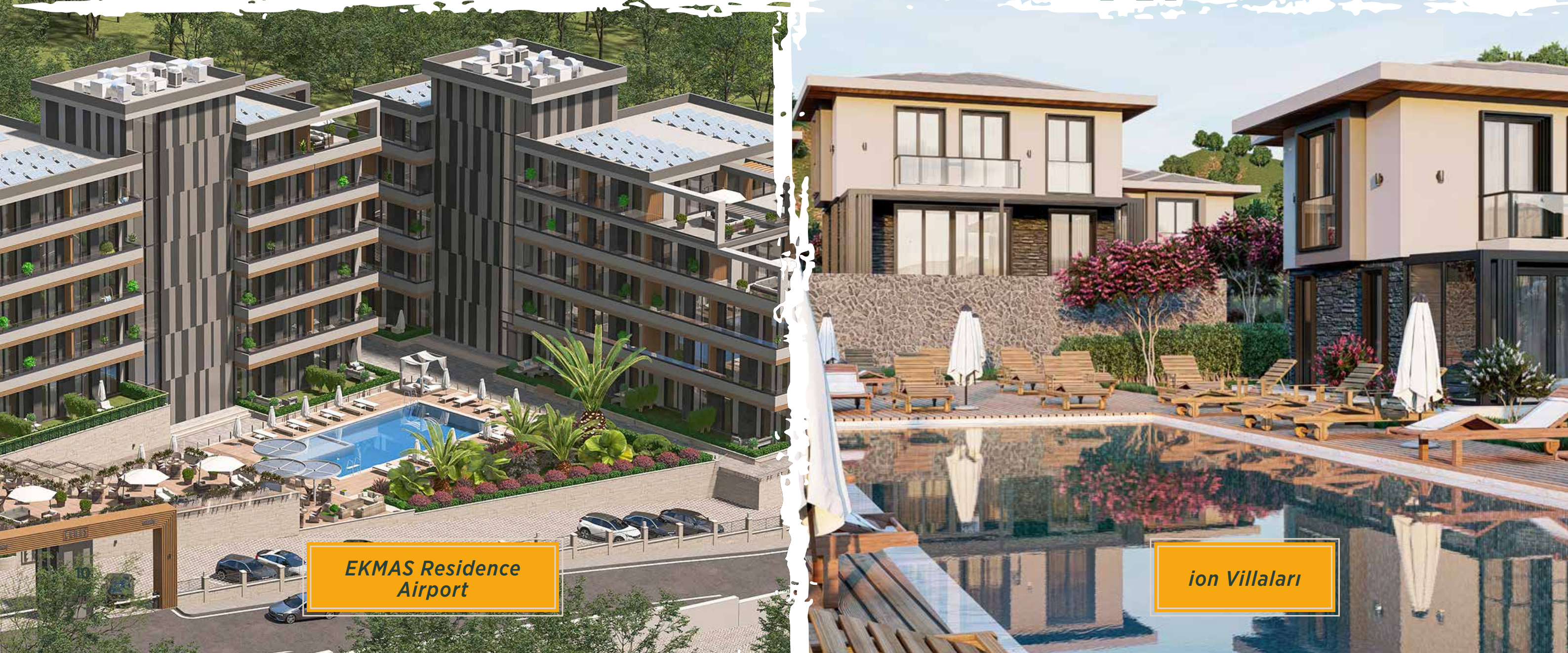
EKMAS Residence Airport